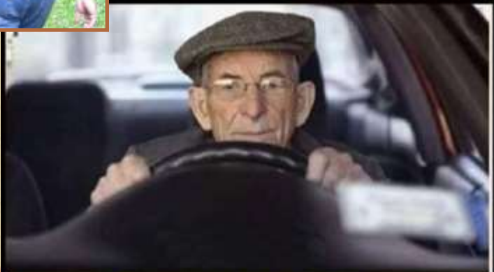
Politiecontrole Om 2 uur 's-nachts

Een oudere man wordt om 2 uur 's-nachts door de politie staande gehouden en wordt gevraagd waar hij om deze tijd naar toe gaat.