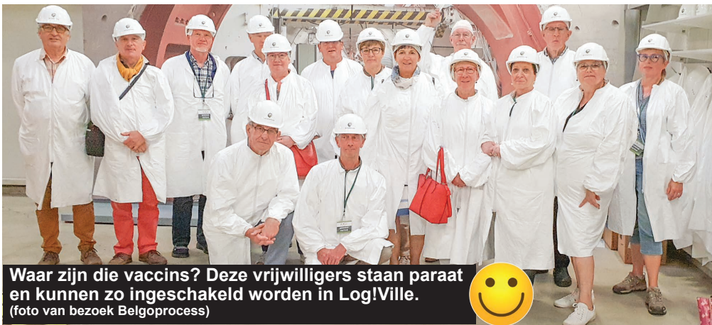
Waar zijn die vaccins? Deze vrijwilligers staan paraat en kunnen zo ingeschakeld worden in Log!Ville. (foto van bezoek Belgoproces)