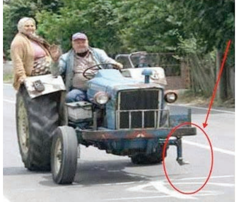
De juiste vrouw brengt evenwicht en stabiliteit