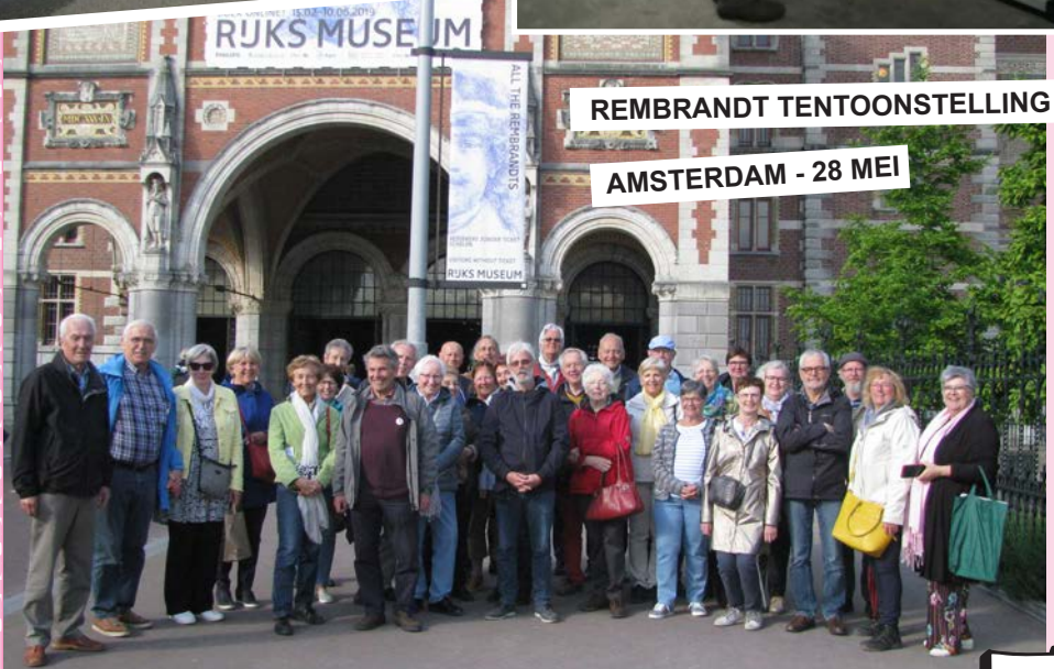
AMSTERDAM - 28 MEI