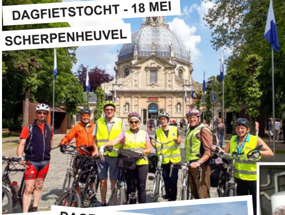
DAGFIETSTOCHT - 18 MEI SCHERPENHEUVEL