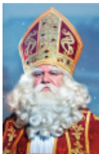
VRT DAG SINTERKLAAS

* Om de terugbetaling te bekomen van de € 8.00 van de sportzegel door CM, maak je een fotokopie (voor- en achterzijde) van de lidkaart (mèt sportzegel 2020 erop!) kleef op de copy een gele klever van CM en deponeer deze in een brievenbus van CM. De terugbetaling komt automatisch op je rekening. Je moet dus GEEN afspraak maken op het CM-kantoor!